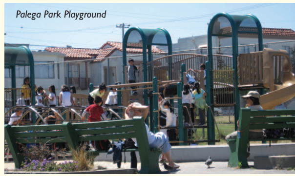
Palega Park Playground

Aim High 2030 Harrison Street, Third Floor San Francisco, CA 94110 Phone: (415) 551-2320 www.aimhigh.org Aim High es un programa gratis que provee servicios academicos durante el verano para jovenes que estan matriculados en la secundaria en el area de la bahia de San Francisco.