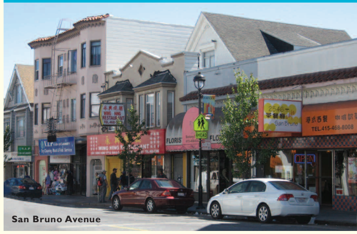
San Bruno Avenue